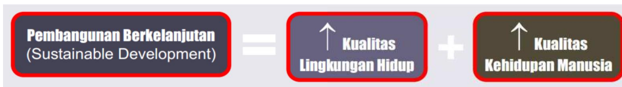
Gambar 1. Sustainable Development Goals (SDGs) Tahun 2030