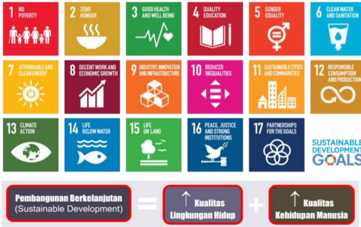
Gambar 1. Sustainable Development Goals (SDGs) Tahun 2030