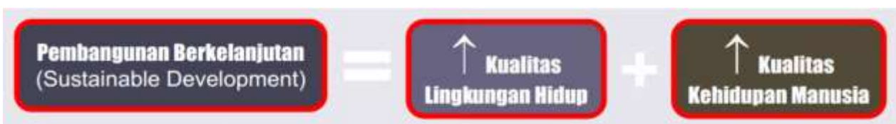
Gambar 1. Sustainable Development Goals (SDGs) Tahun 2030