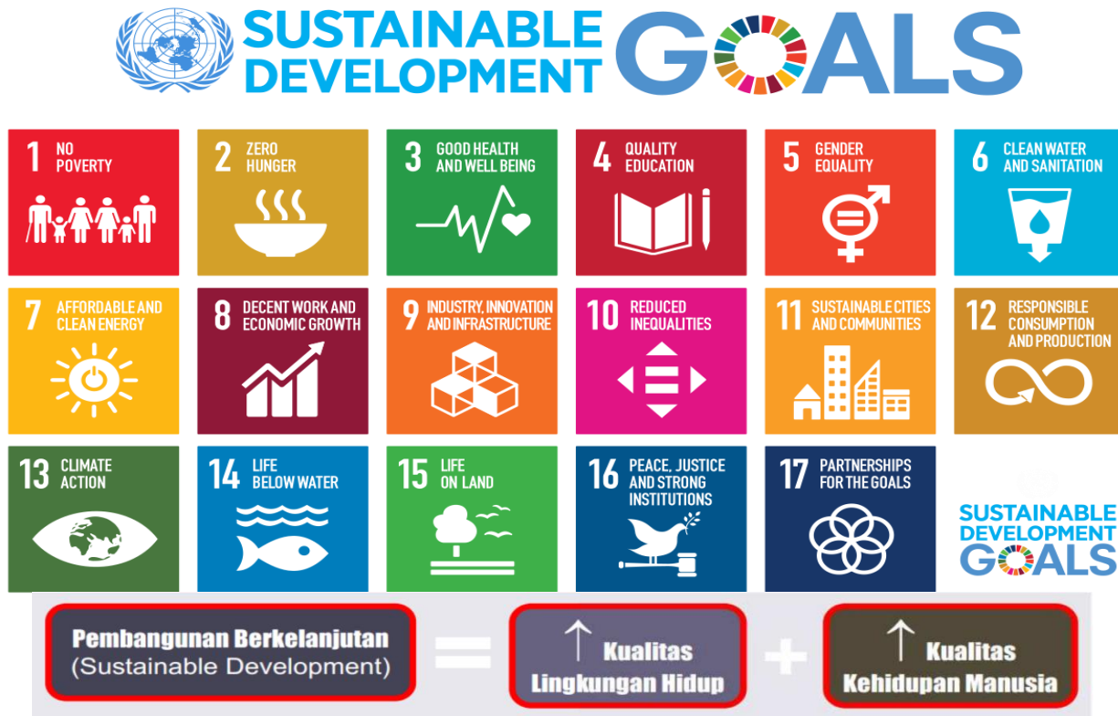
Gambar 1. Sustainable Development Goals (SDGs) Tahun 2030