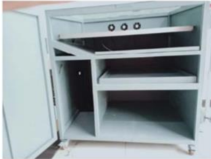
Alat PLTS Untuk Pengering Kupang

Pada sistem PLTS yang dibutuhkan untuk pembangkitan arus yaitu iradian dan suhu. Pada tinjauan suhu, jika suhu PV (Photovoltaic) tinggi maka efisiensi PV akan turun. Salah satu cara untuk menurunkan suhu PV tersebut, maka PV harus dihembuskan angin sehingga panas akan beralih dari permukaan PV. Udara Panas yang dialihkan dari permukaan PV dapat dimanfaatkan untuk kegiatan yang lain. Udara panas yang dialirkan dari permukaan PV akan digunakan untuk mengeringkan kupang (Mytilus Edulis).