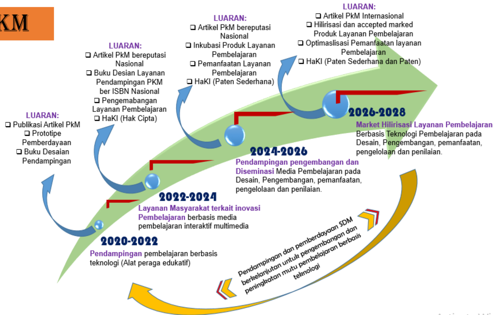
Gambar 2. Road Map Abdimas Dosen