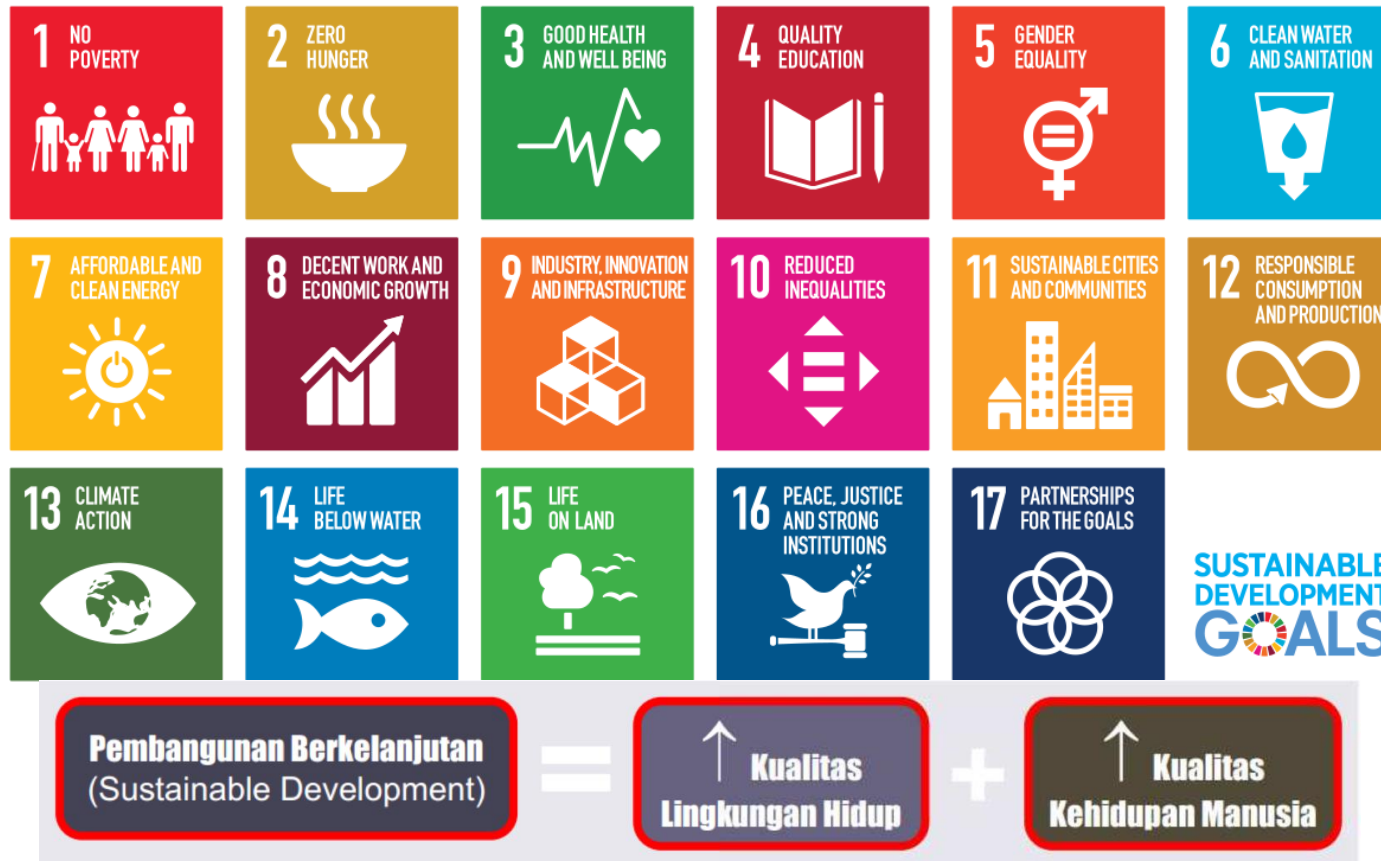
Gambar 1. Sustainable Development Goals (SDGs) Tahun 2030